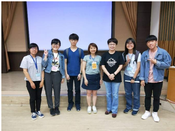
（結束後，與講師們合影留念，及和分組夥伴道別。）

從不同的分組討論、相互認識各校 TA，讓我從他們身上習得不少面對挑戰的態度。因為有些學生已經是擔任了兩、三個學期以上的 TA，頗富經驗，他們的提點也讓我更有信心，一起為台灣教育盡心力。對我而言，兩天的研習也相當充實，對參加研習的人，我認為在暑假期間還到場參加研習的老師或學生，他們的學習動機真的令人敬佩，更是我學習的楷模，不只講台上講師的豐富資訊，其他夥伴的態度更是我欽佩的。